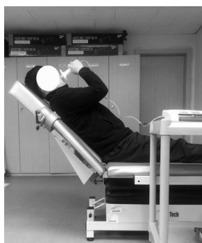
2) 45° 앉은 자세