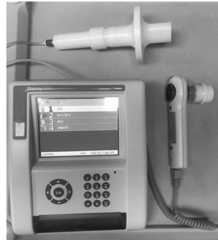
그림 1. 디지털 폐 기능 측정기(Pony FX)