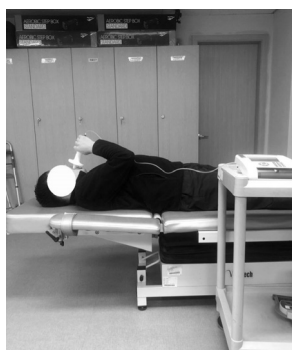
1) 바로 누운 자세