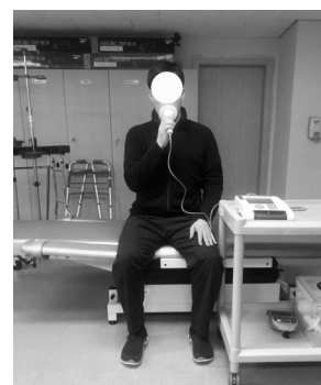
3) 90° 앉은 자세